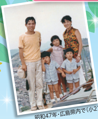
昭和47年・広島県内で(小2)