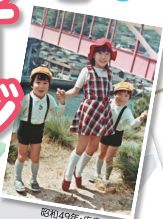
昭和49年・広島・音戸の瀬戸公園で(小4)

「家族と過ごした13年、家族がふたたび、写真のように幸せに暮らせる日々を願って」