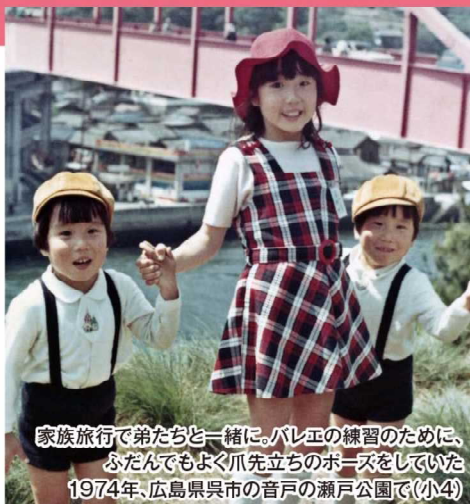
家族旅行で弟たちと一緒に。バレエの練習のために、 ふだんでもよく爪先立ちのポーズをしていた 1974年、広島県呉市の音戸の瀬戸公園で(小4)