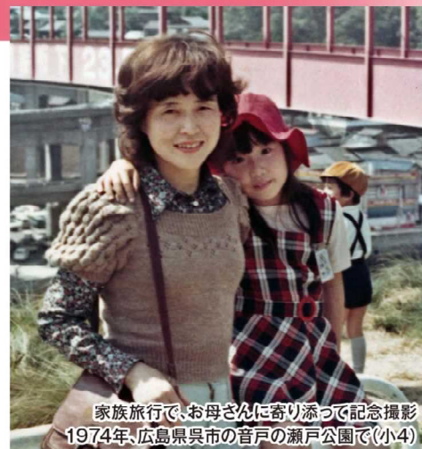
家族旅行で、お母さんに寄り添って記念撮影 1974年、広島県呉市の音戸の瀬戸公園で(小4)